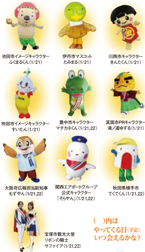
池田市イメージキャラクター ふくまるくん(1/21)