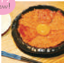
CKR チーズガレット @酒スタンド魚蔵