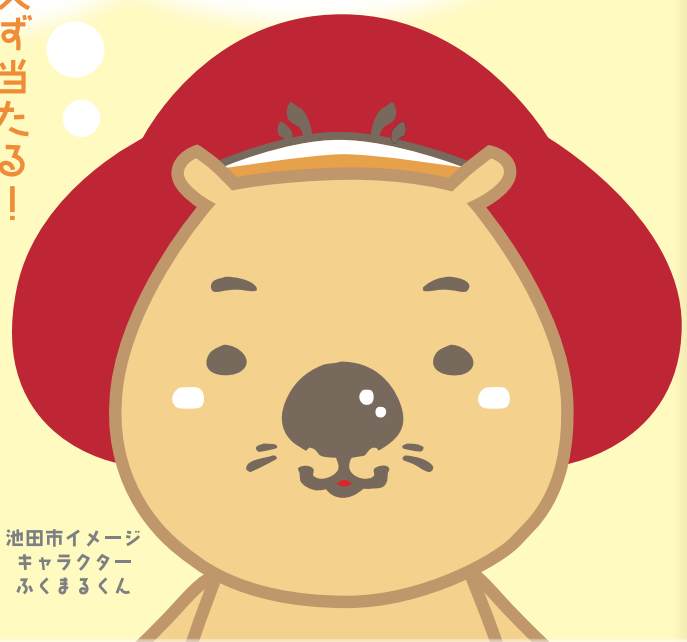
池田市イメージ キャラクター ふくまるくん

■お問い合わせは..... 池田市観光案内所 ☎072-737-7290 (火曜定休) 大阪池田チキチキ探検隊実行委員会事務局 ☎072-754-6241 (池田市役所商工労働課内 / 平日のみ)