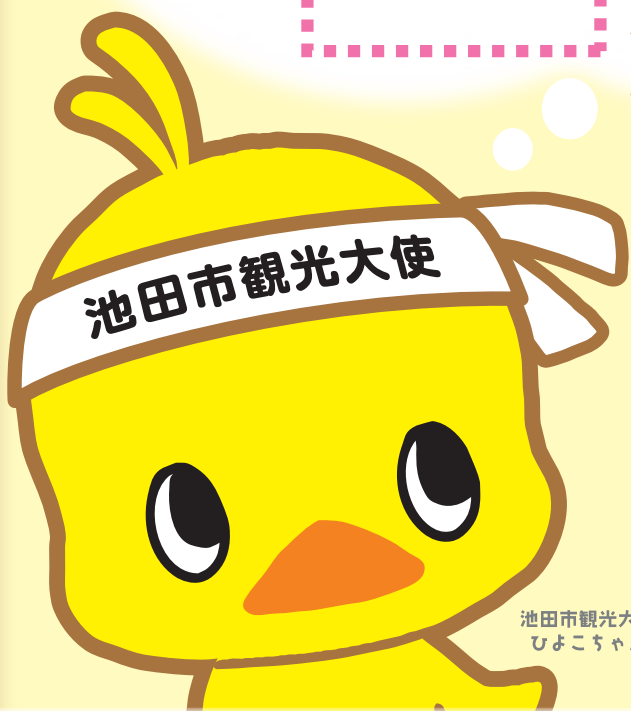
池田市観光大使 ひよこちゃん