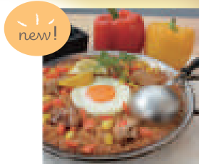
黄金のチキン炒飯 @ChineSe Kichen 由里